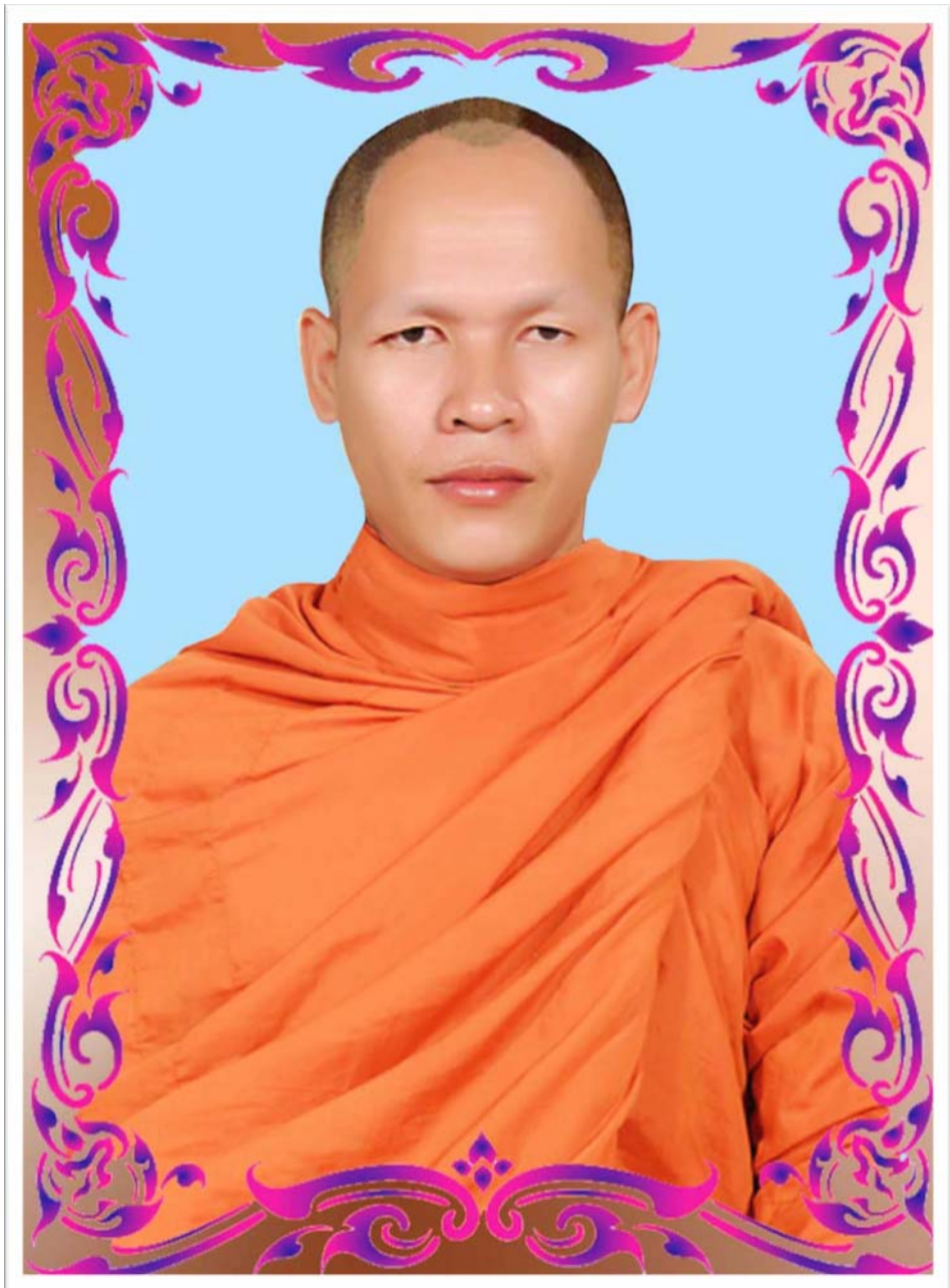
ဦးစွာ ဣန္ဒြေဝေ ဣဇံ-ဗုဒ္ဓိဇာ